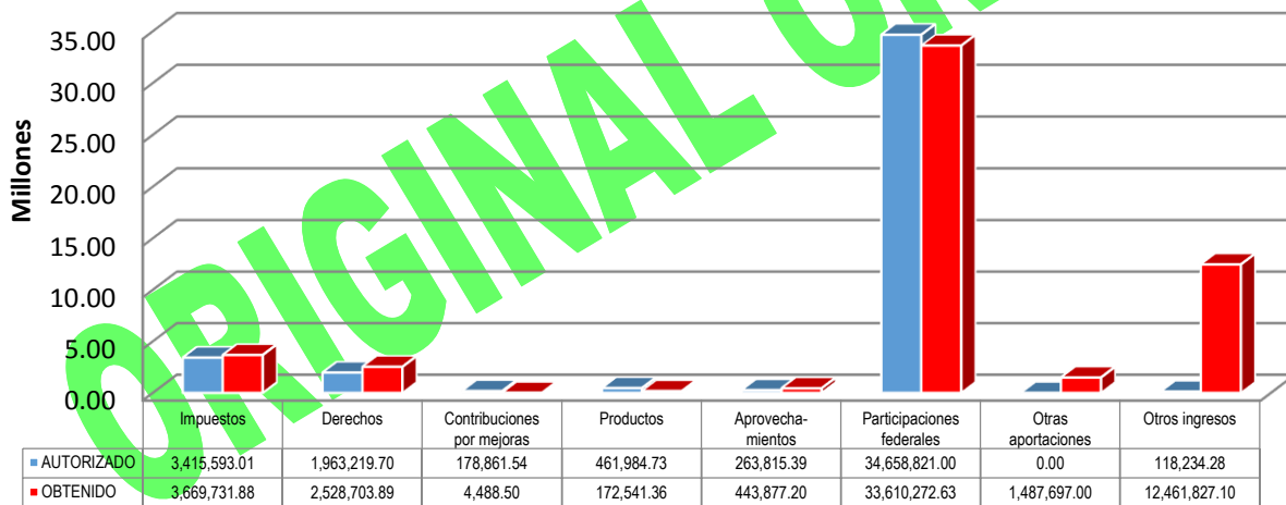
GRÁFICA 1 INGRESOS

Otras aportaciones: FOPADE $1,487,697.00